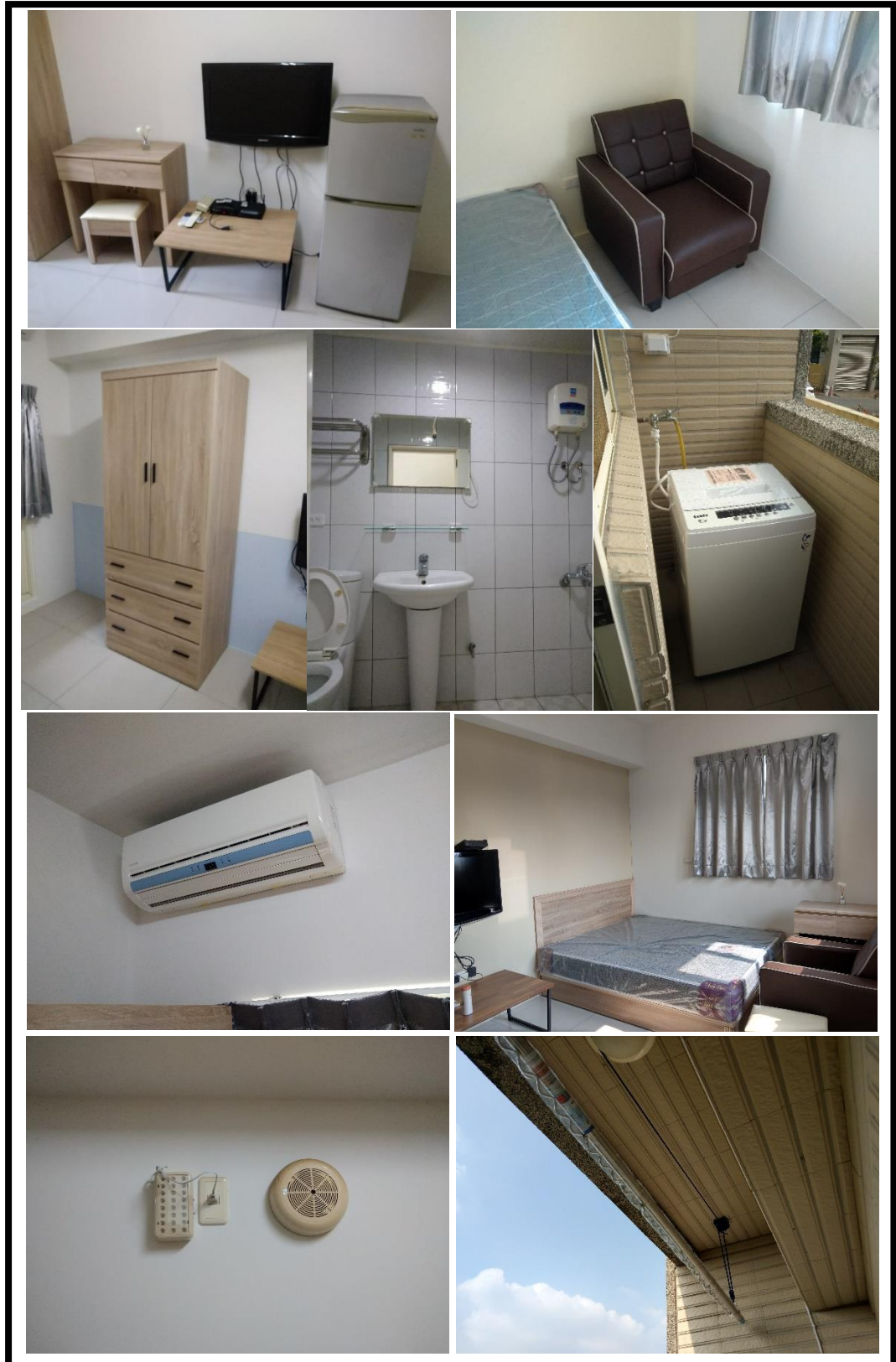
圖 5 室內設備現況

(三) 房間設備：床架、床墊、衣櫥、書桌、書桌椅、茶几、沙發椅及冰箱、冷氣、電熱水器、洗衣機、活動式晒衣桿、緊急照明燈及廣播系統等。