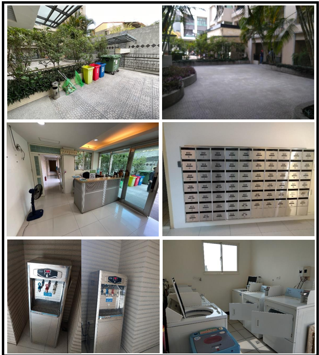
圖 4 公區設備現況

(二) 公共區域部分，本棟建築設有中庭，走廊採單邊設計且面中庭，採光佳，在社區出入口中庭外側車道出入口旁有設置垃圾分類處，進入建物後門口一側設有服務櫃台及住戶信箱區；於一、三、五樓層之通道走廊轉角處有設置自動開飲機；頂樓部分設有投幣式公用洗衣、烘衣機等。為維護社區安全，建物於公共區域範圍設有全天候 CCTV(監視系統)連線保全管控，進出社區以磁扣感應管理。