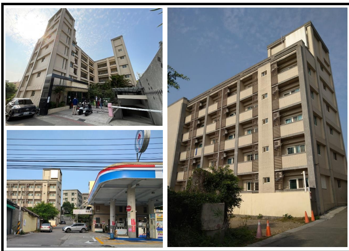
圖 1 巧寓彰化社宅外觀現況

整體基地面積為 740.03 平方公尺(223.86 坪)，建物型態為鋼筋混凝土造地上五層及地下一層之電梯建物，樓地板面積為 2507.75 平方公尺(785.59 坪)，內部格局單純均為單一套房，租賃面積約 9.06~11.57 坪，提供 65 戶供作社會住宅使用。