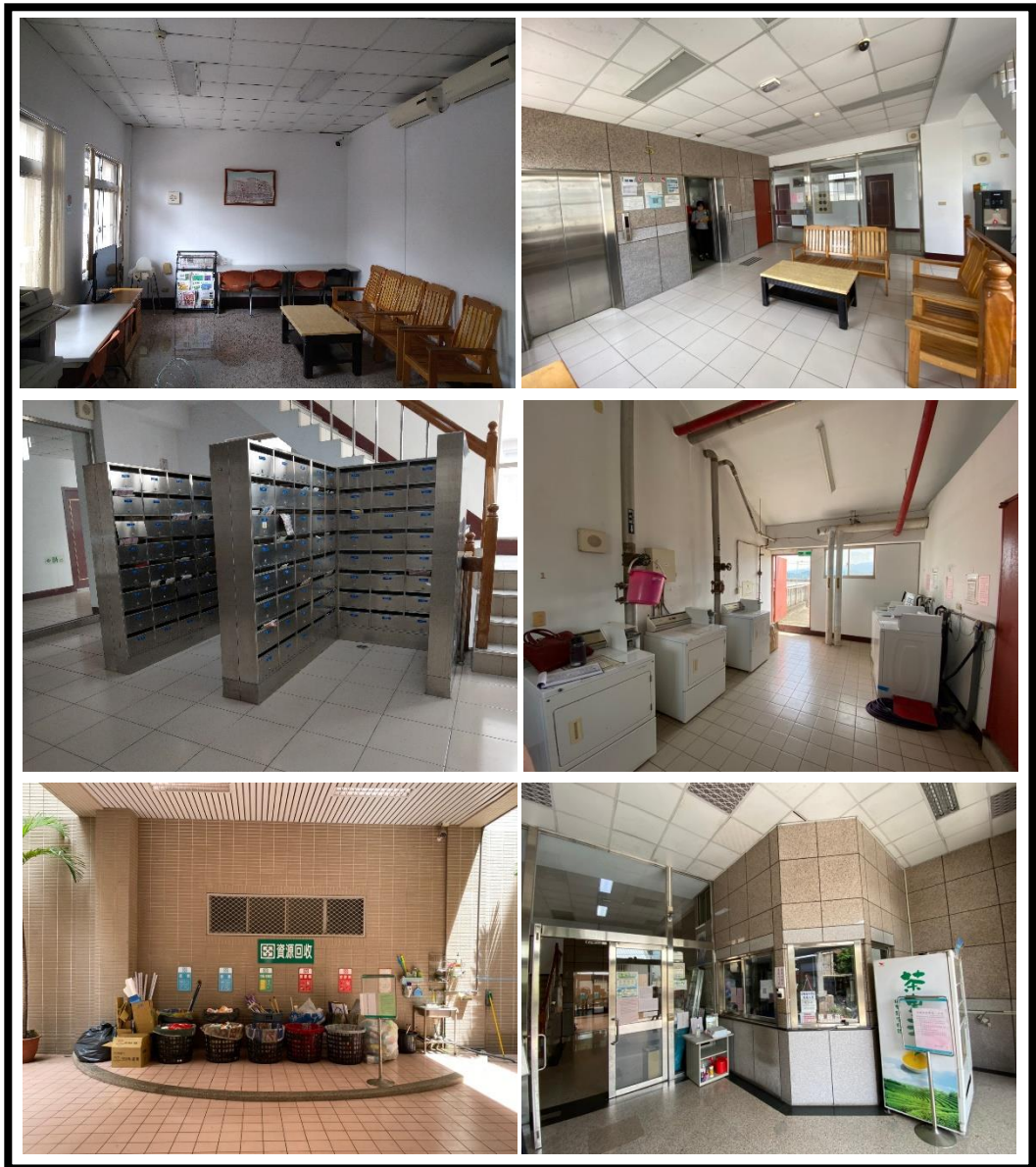
圖 4 公共區域設置現況

為了提供住宿者的舒適、便捷及安全的居住環境外，除了備有符合主管機關要求建築公共安全衛生、消防安全、逃生避難及民生必需的各項基礎設施、設備外，學苑特設置管理中心，由專人管理維護設施並提供服務；公共區域主要位於地面層，公共區域設有大廳服務台、信箱區、自助洗衣房、閱覽室、垃圾處理室，另於各層電梯旁梯廳設置會客室及開飲機，另設有電腦門禁刷卡控制系統、錄影系統，進出管控，安全有保障。