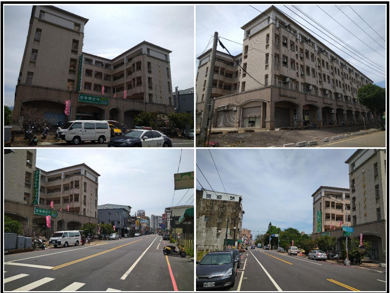
圖 1 台糖苗栗學苑社宅外觀及臨路現況

整體基地面積為 3,604.69 平方公尺(1,090.42 坪)，建物型態為鋼筋混凝土造地上五層及地下一層之電梯建物，樓地板面積為 10,188.77 平方公尺(3,082.10 坪)；加入社宅部分(第二層以上)內部格局單純，主要區分為大、小套房等二種房型，室內面積約 4.57~12.63 坪，共計提供 220 戶供作社會住宅使用。