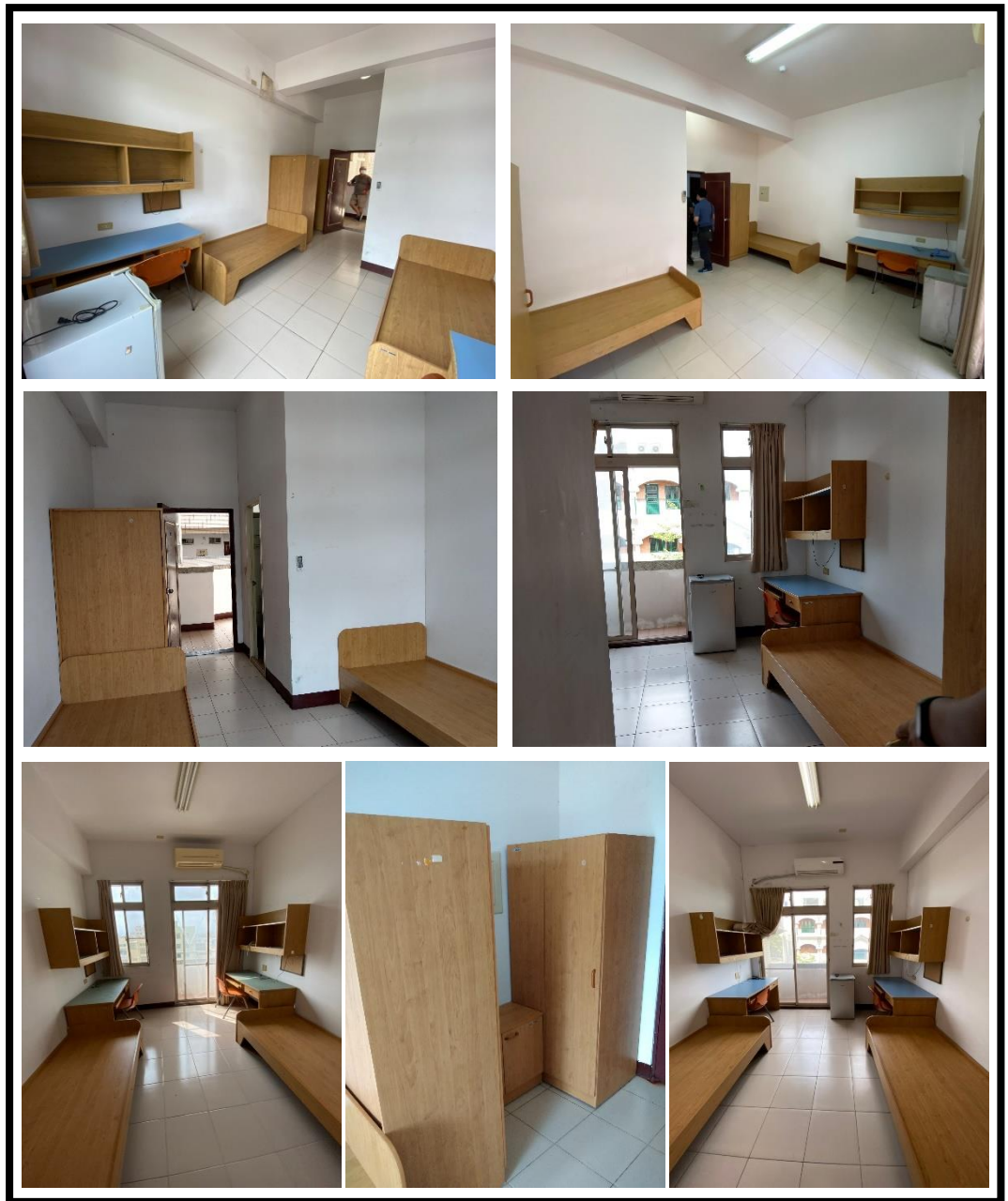
圖 5 各房型室內設備提供現況

各房型室內設有專屬浴廁、玄關（備個人衣櫥、鞋櫃）、休息區、工作區（書桌椅、書架）。各項傢俱均美觀、實用、堅固，配合住宿需要及空間整體設計，並有具防焰窗簾，不僅符合個人隱私的需要，且為提高了安全性，於室內設有緊急照明燈及廣播系統等。