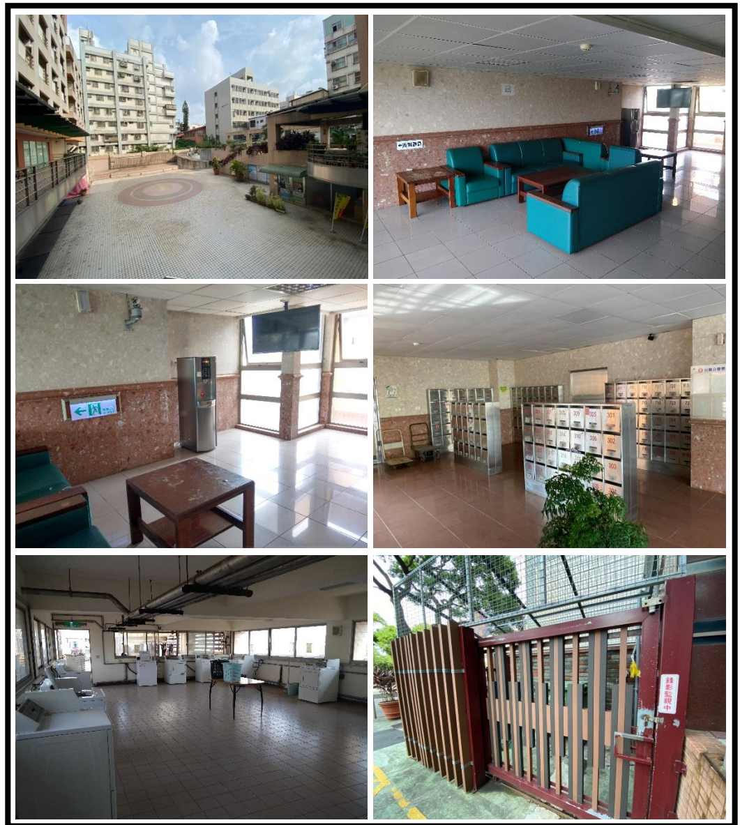
圖 4 公共區域設置現況

為了提供住宿者的舒適、便捷及安全的居住環境外，符合主管機關要求建築公共安全衛生、消防安全、逃生避難及民生必需的各項基礎設施、設備外，學苑特設置管理中心，由專人管理維護設施並提供服務；公共區域主要位於第二層以上，設有大廳服務台、信箱區、自助洗衣房(頂樓)、垃圾處理室(地面層)、會客室(第三至七層)，會客室另設有飲水機，戶外區的中庭廣場等公共空間等，另設有電腦門禁刷卡控制系統、錄影系統，進出管控安全有保障。