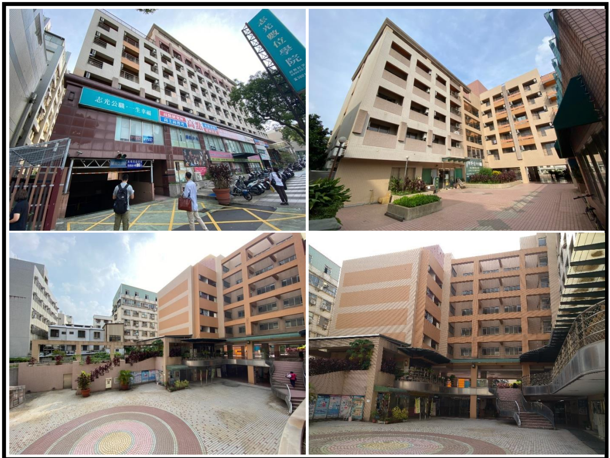
圖 1 台糖公營學苑社宅外觀及中庭現況

整體基地面積為 4,448 平方公尺(1,345.52 坪)，建物型態為鋼筋混凝土造地上七層及地下三層之電梯建物，樓地板面積為 20,721.19 平方公尺(6,268.16 坪)；加入社宅部分(第三層以上)內部格局單純，主要區分為小套房、大套房等四種房型，室內面積約 6.00~14.27 坪，共計提供 203 戶供作社會住宅使用。