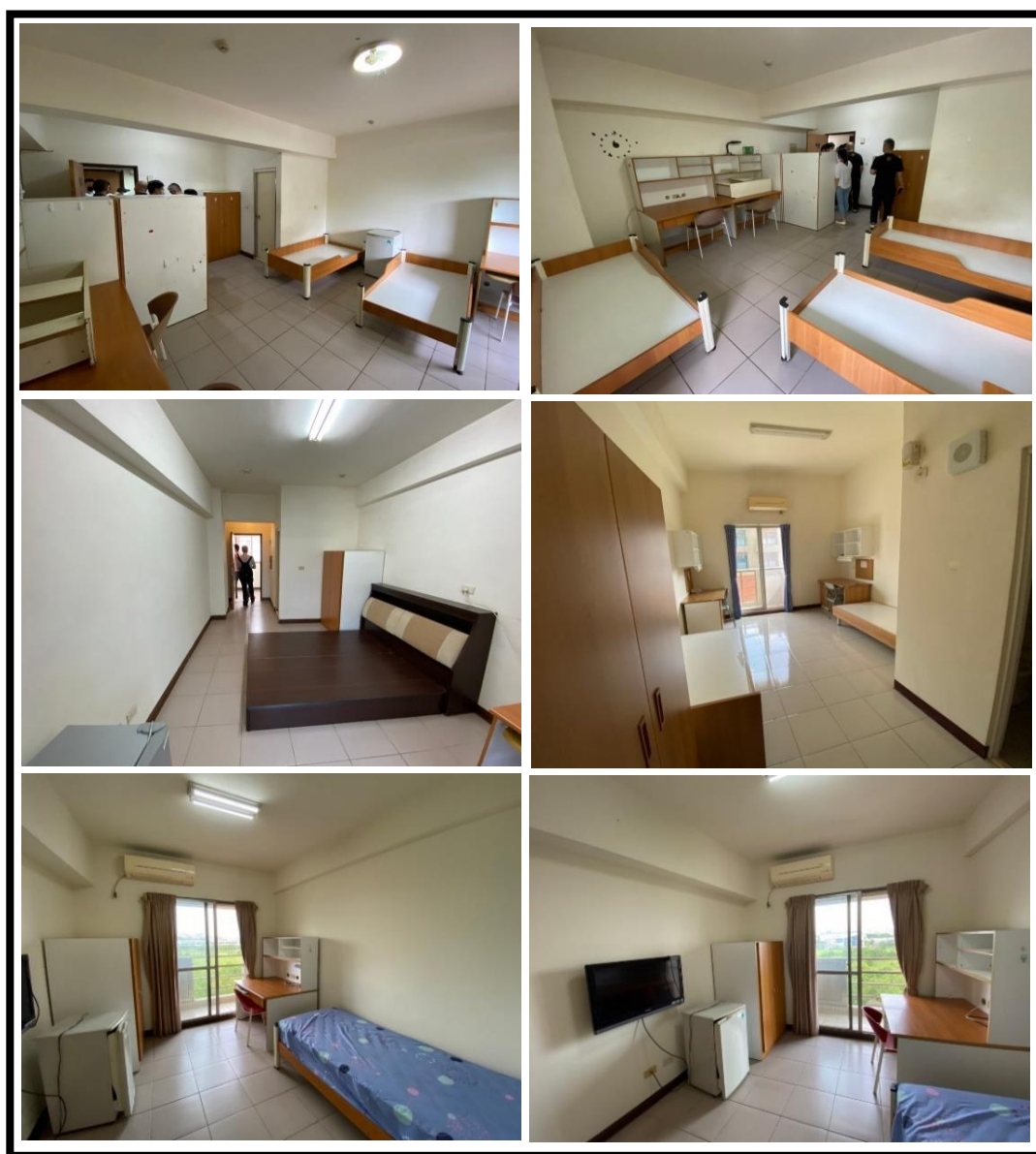
圖 5 各房型室內設備提供現況

各房型室內設有專屬浴廁、玄關（備個人衣櫥、鞋櫃）、休息區、工作區（書桌椅、書架）。各項傢俱均美觀、實用、堅固，配合住宿需要及空間整體設計，並有具防焰窗簾，不僅符合個人隱私的需要，且為提高了安全性，於室內設有緊急照明燈及廣播系統等。