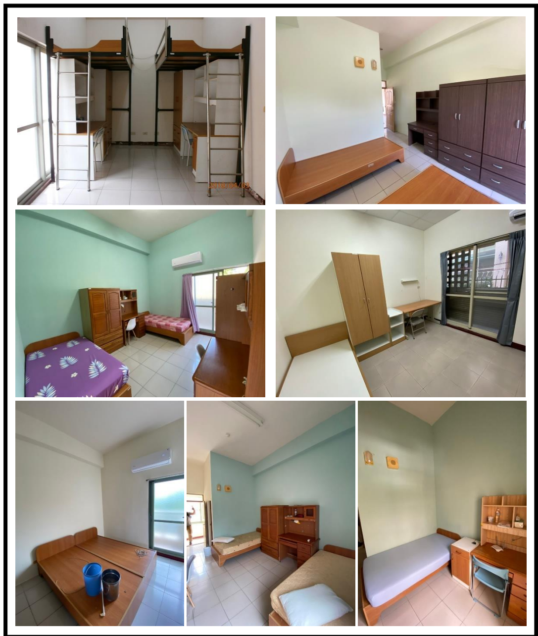
圖 5 各房型室內設備提供現況

各房型室內設有專屬浴廁、玄關（備個人衣櫥）、休息區、工作區（書桌椅、書架），四人房作息區則採立體區劃，各項傢俱均美觀、實用、堅固，配合住宿需要及空間整體設計，並有具防焰窗簾，不僅符合個人隱私的需要，且為提高了安全性，於室內設有緊急照明燈及廣播系統等。