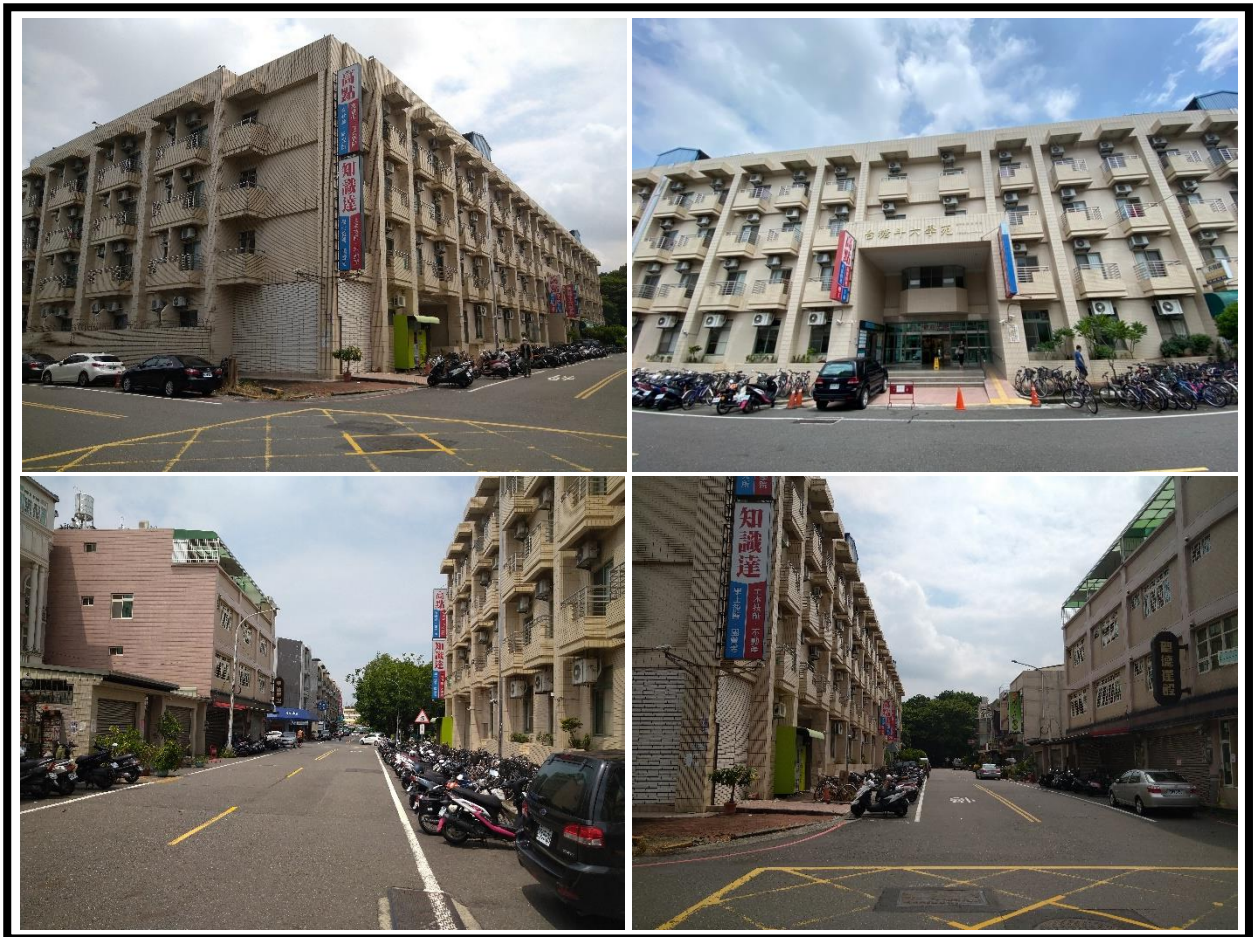
圖 1 台糖斗六學苑社宅外觀及臨路現況

整體基地面積為 4,550.80 平方公尺(1,376.62 坪)，建物型態為鋼筋混凝土造地上四層及地下一層之電梯建物，樓地板面積為 12,369.12 平方公尺(3,741.66 坪)；加入社宅部分內部格局單純，主要區分為單人、雙人(大、小)、四人套房等四種房型，室內面積約 4.22~8.97 坪，共計提供 200 戶供作社會住宅使用。