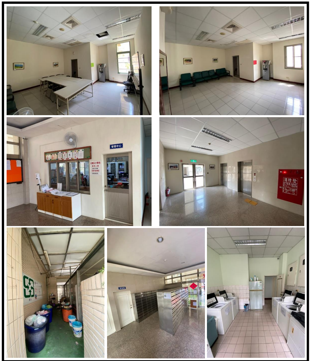
圖 4 公共區域設置現況

提供房客舒適、便捷及安全的居住環境外，符合主管機關要求建築公共安全、消防安全、逃生避難、衛生及民生必需的各项基礎設施、設備，並設置管理中心，由專人管理維護設施與提供服務；公共區域主要位於地面層，設有大廳服務台、信箱區、自助洗衣房、交誼廳、垃圾處理室，於各層交誼廳室內設有開飲機；為管控人員進出於公共區域範圍設有全天候錄影系統連線、電腦門禁刷卡控制系統等進出管控，安全有保障。