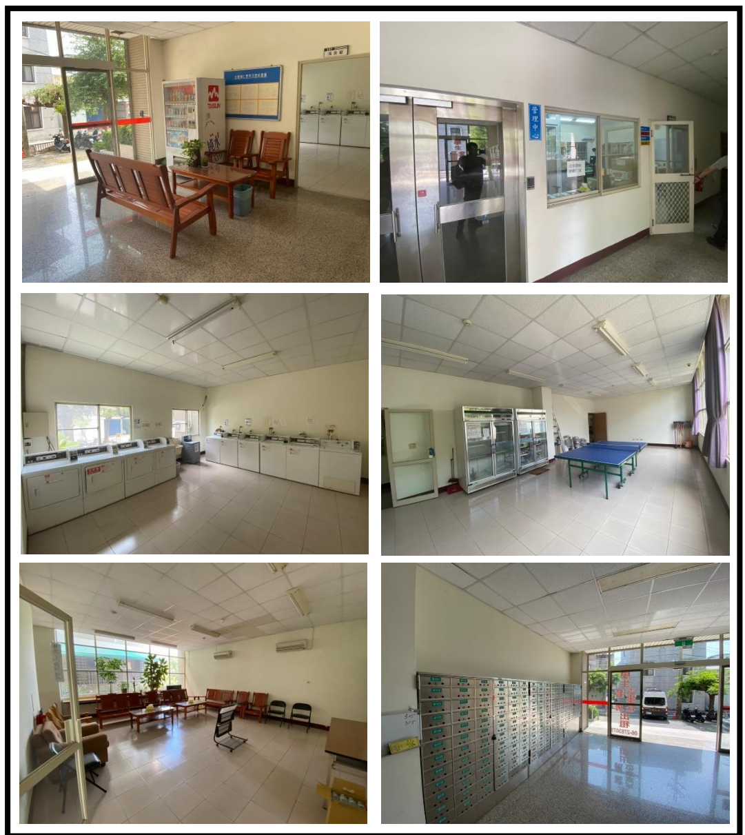
圖 4 公共區域設置現況

為了提供住宿者的舒適、便捷及安全的居住環境外，符合主管機關要求建築公共安全、消防安全、逃生避難、衛生及民生必需的各項基礎設施、設備外，學苑特設置管理中心，由專人管理維護設施並提供服務；公共區域主要位於地面層，公共區域設有大廳服務台、信箱區、自助洗衣房、會客室(書報閱覽室)、垃圾處理室，各層電梯旁梯廳設置開飲機；公共區域範圍設有電腦門禁刷卡控制系統、全天候錄影系統連線等進出管控，安全有保障。