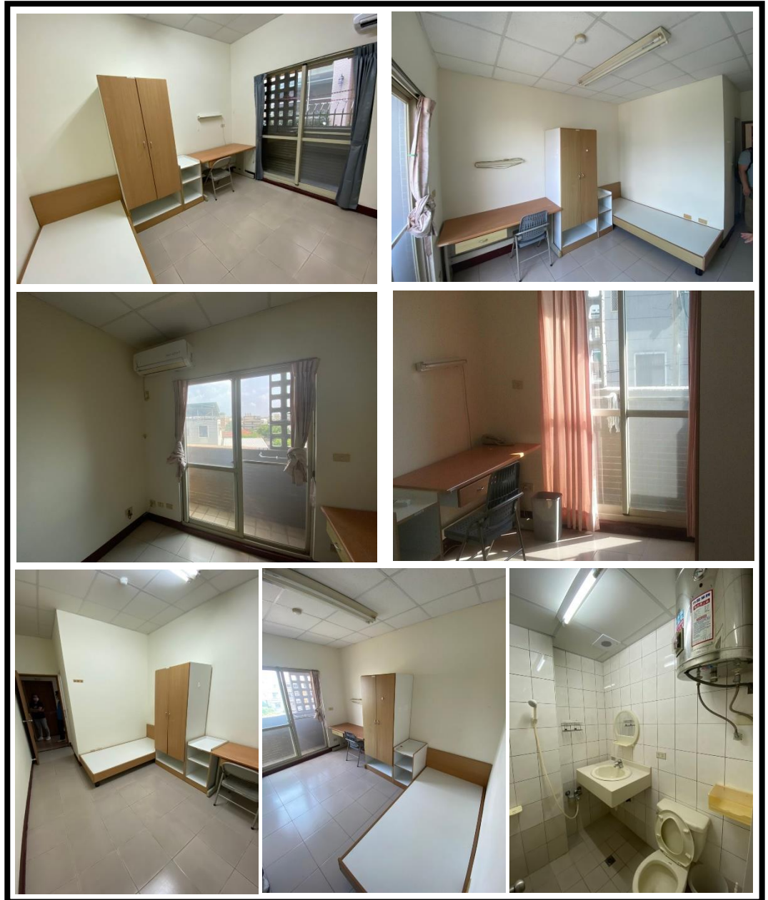
圖 5 各房型室內設備提供現況

各房型室內設有專屬浴廁、玄關（備個人衣鞋櫃）、休息區、工作區（書桌椅、書架）。各項傢俱均美觀、實用、堅固，配合住宿需要及空間整體設計，並有具防焰窗簾，不僅符合個人隱私的需要，且為提高了安全性，於室內設有緊急照明燈及廣播系統等。