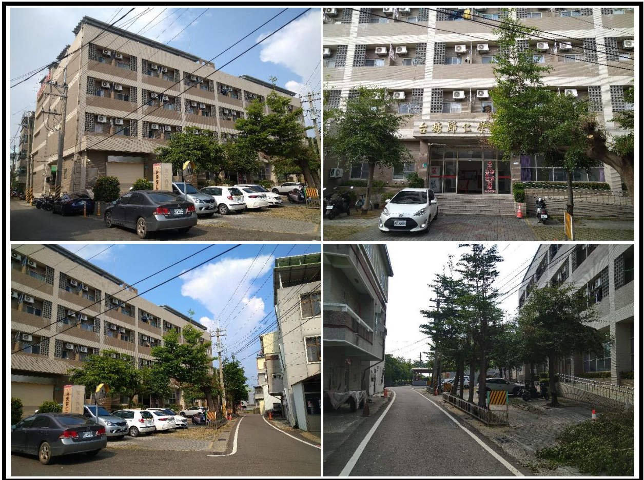
圖 1 台糖歸仁學苑社宅外觀及臨路現況

整體基地面積為 2,233.63 平方公尺(675.67 坪)，建物型態為鋼筋混凝土造地上四層及地下一層之電梯建物，樓地板面積為 5,534.59 平方公尺(1,674.21 坪)；加入社宅部分內部格局單純，主要區分為單人套房、單人(大)套房及三人雅房等三種房型，室內面積約 4.72~29.29 坪，共計提供 202 戶供作社會住宅使用。