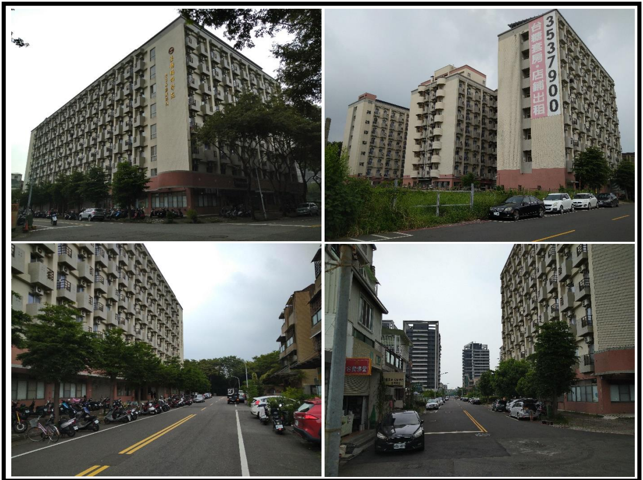
圖 1 台糖楠梓學苑社宅外觀及臨路現況

整體基地面積為 4,180.91 平方公尺(1,264.73 坪)，建物型態為鋼筋混凝土造地上八層及地下一層之電梯建物，樓地板面積為 19,175.9 平方公尺(5,800.71 坪)；加入社宅部分(第二層以上)內部格局單純，主要區分為單人、雙人(大、小)、三人套房等四種房型，室內面積約 4.07~8.95 坪，共計提供 544 戶供作社會住宅使用。