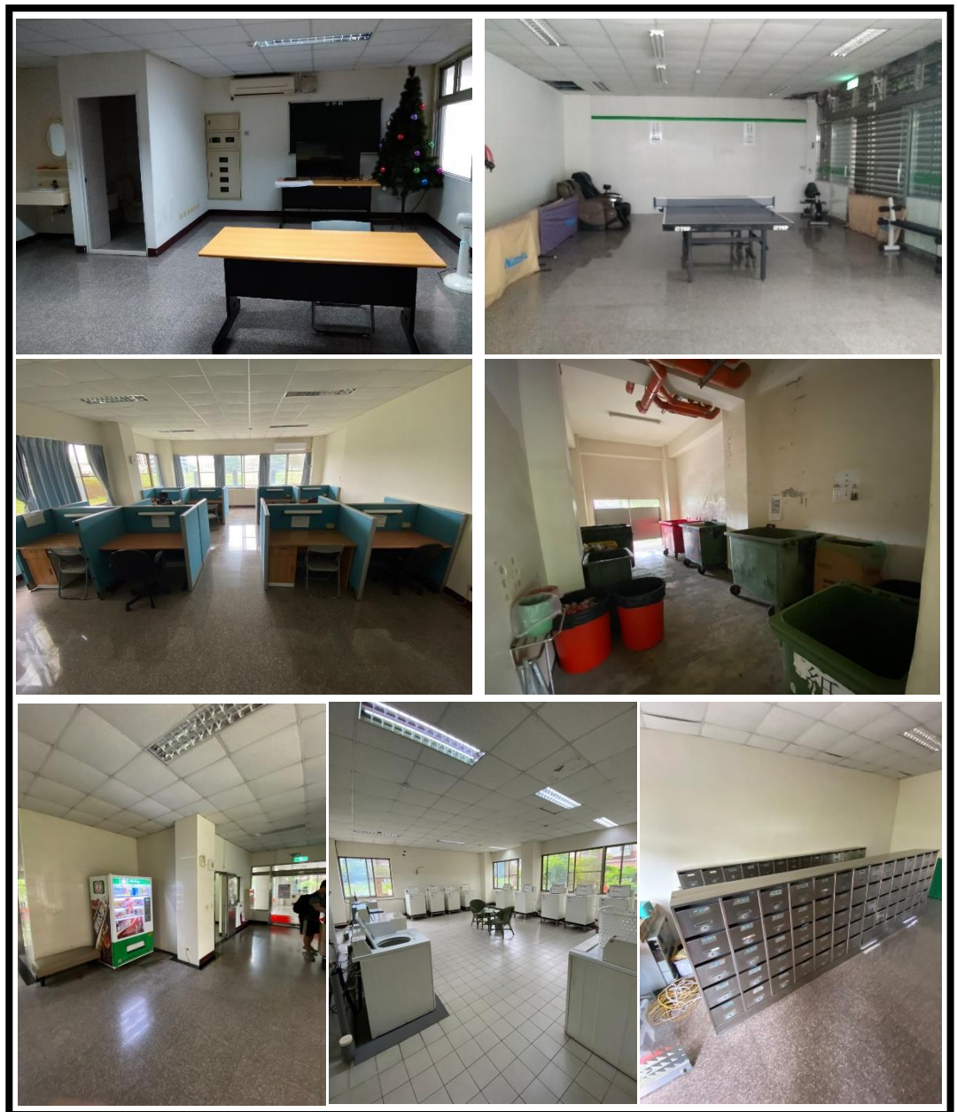
圖 4 公共區域設置現況

本社宅公共區域主要位於地面層，設有大廳服務台、信箱區、自助洗衣房、閱覽室(K 書中心)、垃圾處理室，另於各層電梯旁梯廳設置會客室及開飲機；大廳服務台設有專人管理服務，另於各樓層公共空間專人清潔服務；為維護社區安全，建物於公共區域範圍設有 24 小時監視錄影、電腦門禁刷卡控制系統等進出管控，安全有保障。