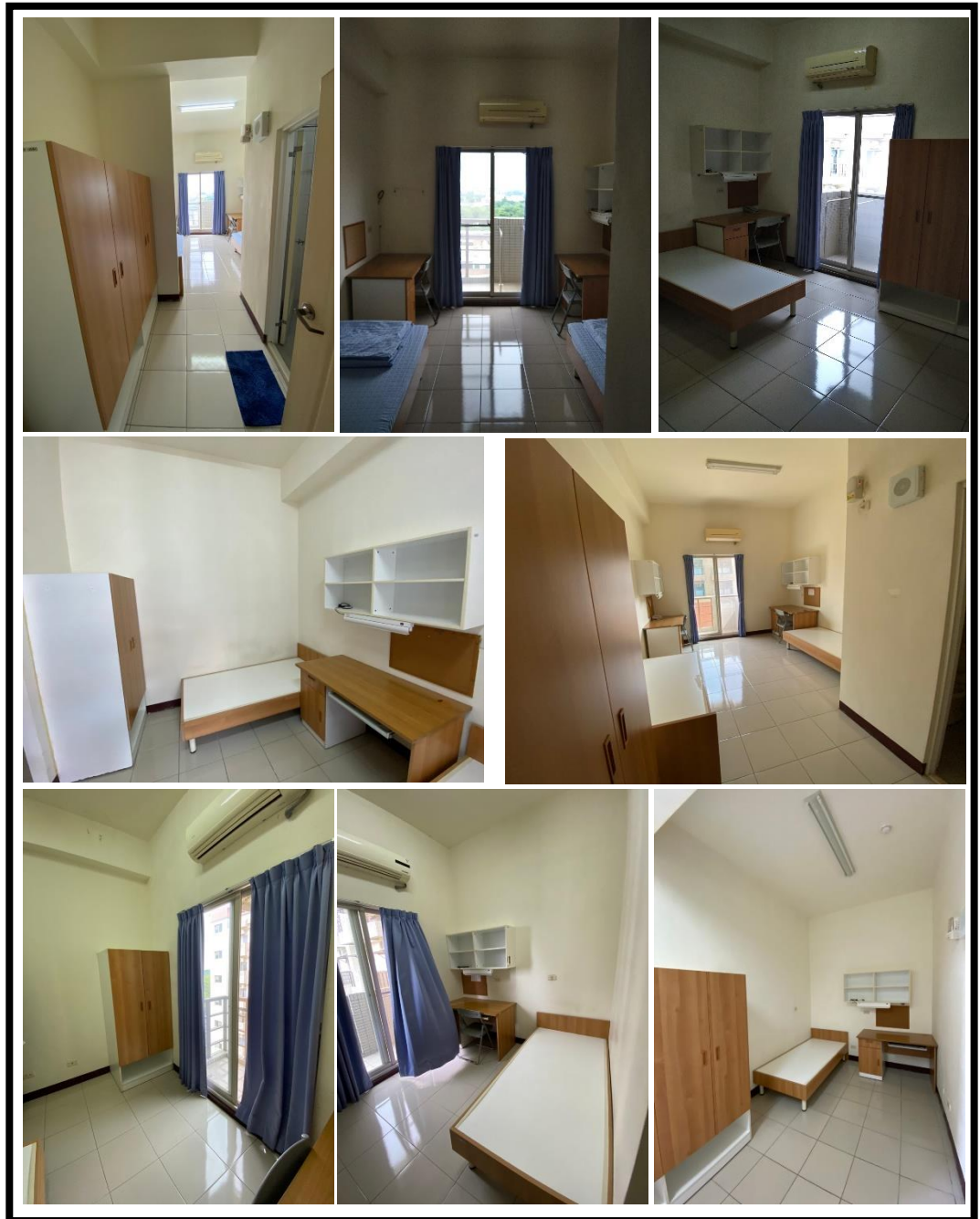
圖 5 各房型室內設備提供現況

各房型室內均提供床架、衣櫥及書桌四件組(桌、椅、書櫃及桌燈)及冷氣、緊急照明燈及廣播系統等，另各房間有獨立陽台，備有曬衣架可供曬衣用，頂樓另有大型採光罩與曬衣架。