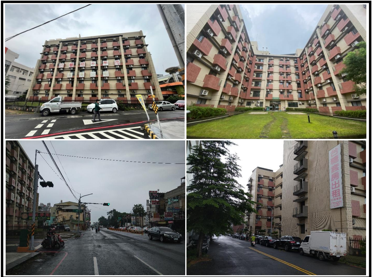
圖 1 台糖椰林學苑社宅外觀及臨路現況

整體基地面積為 3,365.00 平方公尺(1,017.91 坪)，建物型態為鋼筋混凝土造地上六層及地下一層之電梯建物，樓地板面積為 8,290.76 平方公尺(2,507.95 坪)；加入社宅部分內部格局單純，主要區分為小套房、大套房等四種房型，室內面積約 4.55~6.88 坪，共計提供 229 戶供作社會住宅使用。