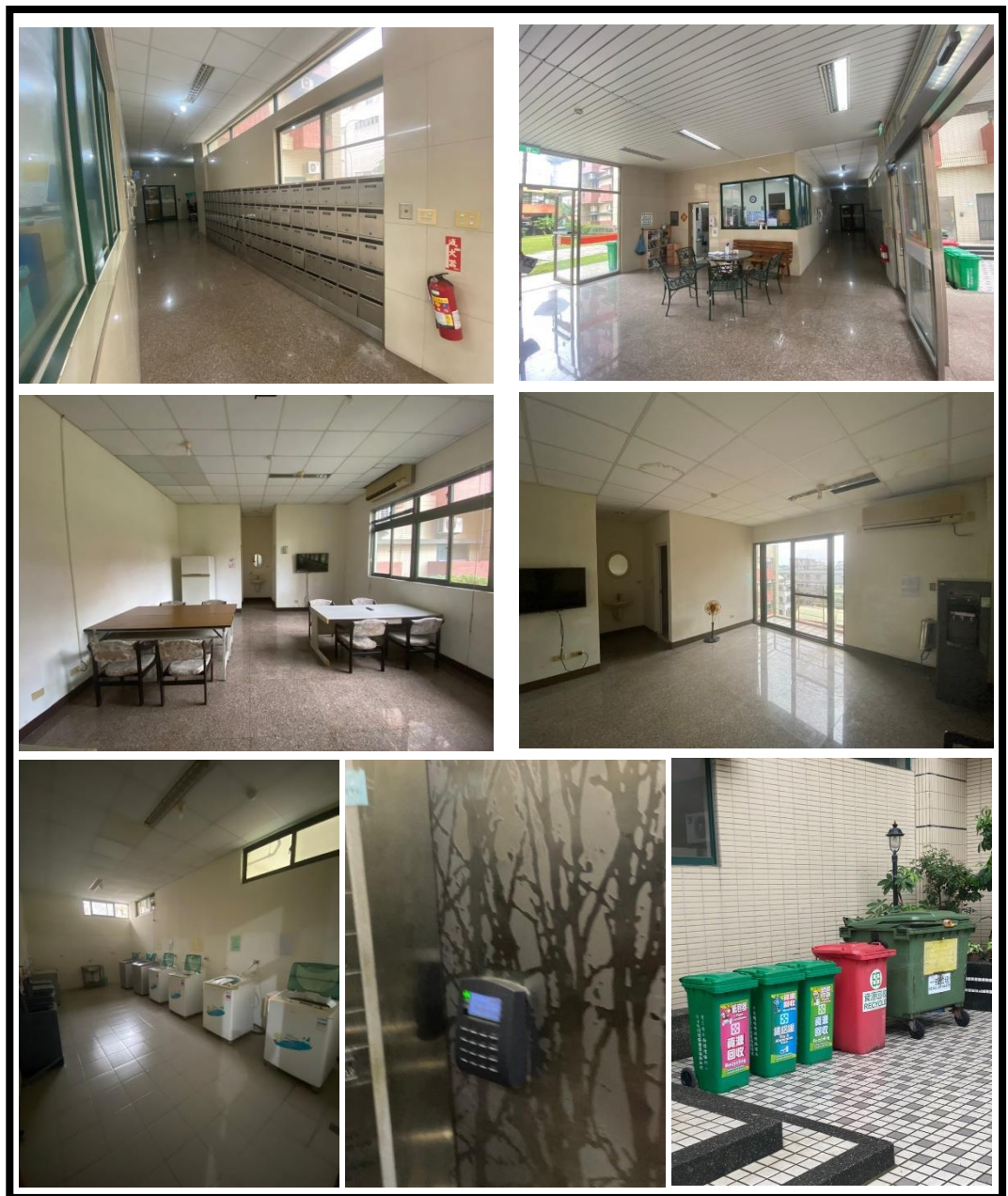
圖 4 公共區域設置現況

為了提供住宿者更舒適、便捷及最重要的安全環境，並符合主管機關要求建築公共安全、消防、逃生避難安全、衛生等規定，本學苑特設置管理服務中心，由專人管理維護設施並提供服務；公共區域主要位於地面層、各層會客室，除大廳服務台、信箱區、自助洗衣房(頂樓)、垃圾處理室(戶外中庭)、會客室空間內另設置飲水機；為管控人員進出於公共區域範圍設有全天候錄影系統連線，進出以磁扣感應管理，安全有保障。