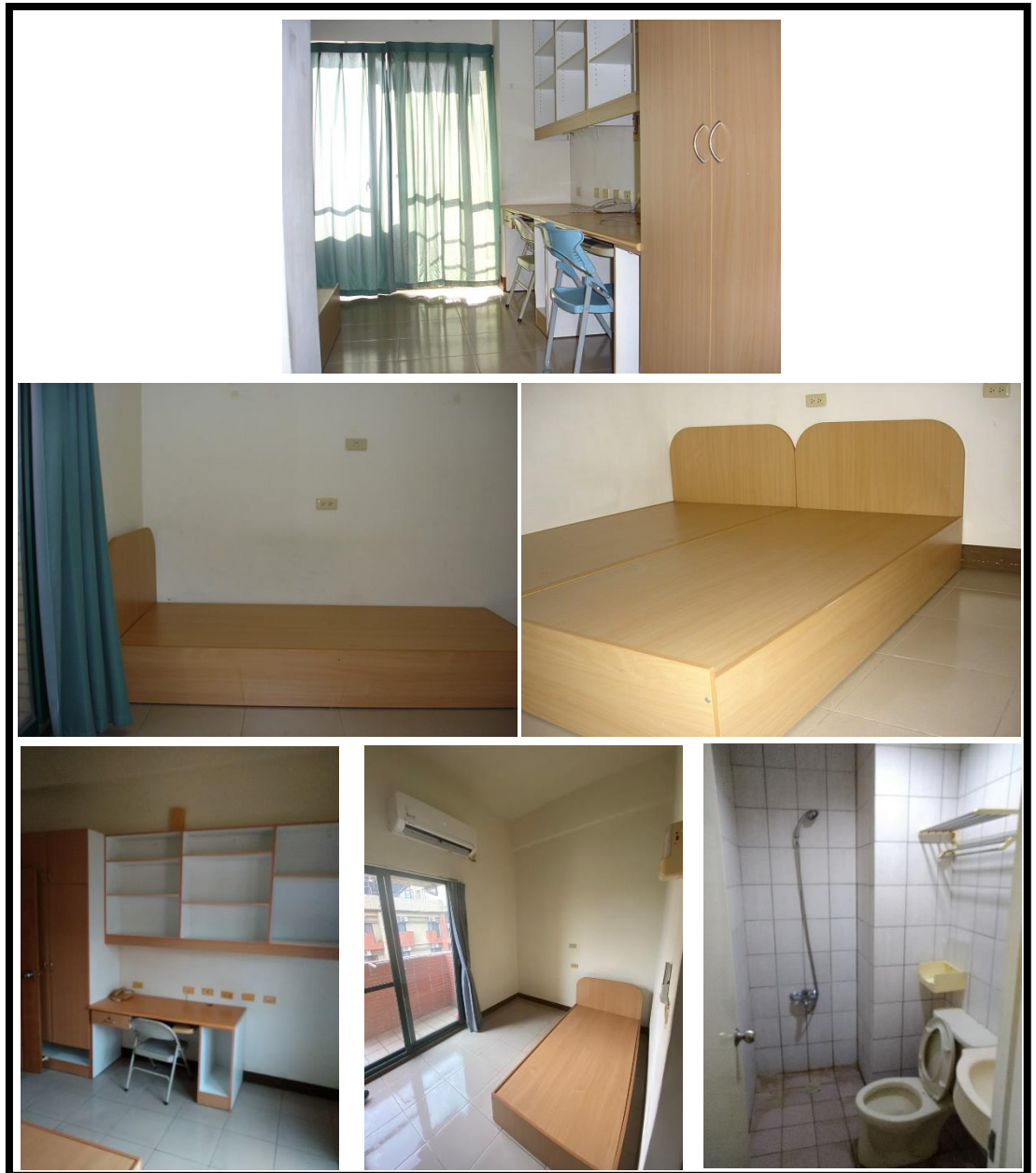
圖 5 各房型室內設備提供現況

各房型室內設有專屬浴廁、玄關（備個人衣櫥、鞋櫃）、休息區、工作區（書桌椅、書架）。各項傢俱均美觀、實用、堅固，配合住宿需要及空間整體設計，並有具防焰窗簾，不僅符合個人隱私的需要，且為提高了安全性，於室內設有緊急照明燈及廣播系統等。